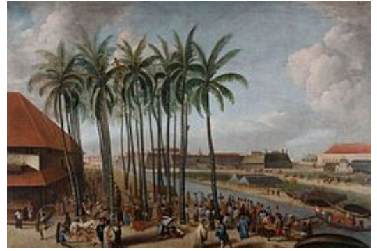
Olieverfschilderij door Andries Beeckman voorstellende het Kasteel Batavia gezien van Kali Besar west met op de voorgrond de Passar Ikan (vismarkt) (ca 1662), collectie Tropenmuseum