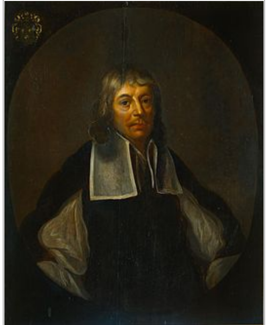
Gouverneur-generaal Joan Maetsuycker